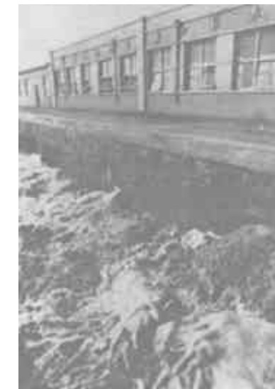
图为开发滩涂建起的扬水站

在黄河入海口处，有大片新淤地，被称为盛产大豆的“金滩地”。这里生产的大豆，由于不受环境、农药的污染，色泽金黄，粒大籽圆，豆腐极好，仍保持大豆原始的豆香，受到人们的青睐。每年，垦利播种大豆20万亩左右，收获大豆近2000万公斤。目前，垦利已出口大豆20多万公斤，出口豆饼2000吨，为国家创了外汇。