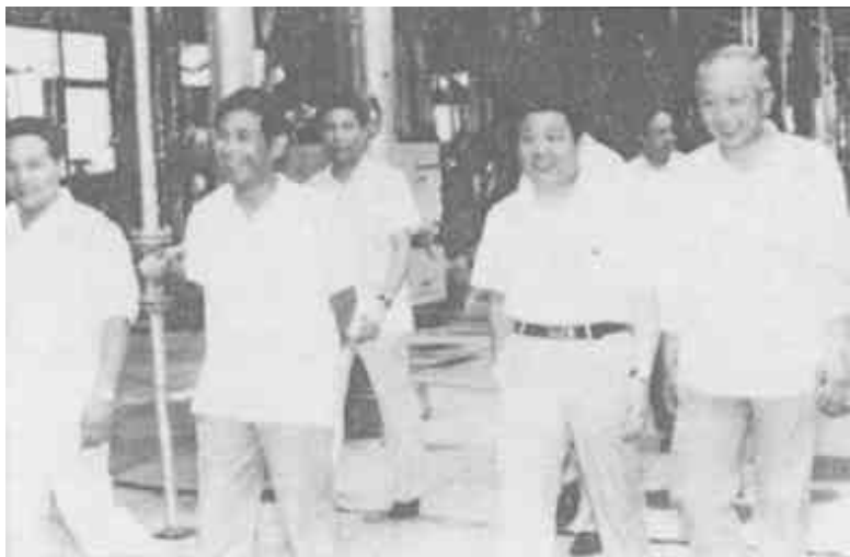
△副省长马忠臣（左四）在市、县领导陪同下，视察垦利县工业生产情况。

镇企业走工、商、建、运、服等各行业协调发展的道路，向多层次、多形式、集团化方向发展。众多企业在全国72个地、市建立了协作关系，与全国15所大专院校和科研机构建立了科技咨询关系，获得了技术信息260多条。胜坨乡地毯厂与山东畜产品进出口公司济南支公司协作的2个品种、10个规格的地毯项目，产品打入国际市场。目前，全县经济联合协作项目为80多个，引进外资600万元，引进各类专业技术人才256名，完成物资协作金额1316万元。这个县依靠丰富的自然资源搞深加工，瞄准国外市场，发展外向型经济。苇帘、田菁胶、地毡、80号石油繁重道路沥青等产品已通过外贸部门出口；皮毛、泥陶、花生制品、翻砂制品等已列入出口规划。