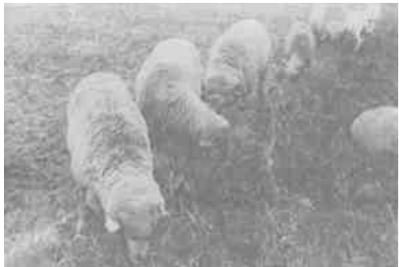
从澳大利亚引进的美利奴良种羊在垦利县辽阔的草原上安家落户。

“九曲黄河万里沙，浪淘风簸自天涯”。中华民族的母亲河——黄河，汇千流，纳百川，纵横5400公里，汇入浩瀚的渤海。在海与河的交汇处，来自黄土高原的大量泥沙淤积延伸，几经沧桑，演化出一块新生的淤积平原，这就是闻名的黄河三角洲。垦利县就座落在这块三角洲上。